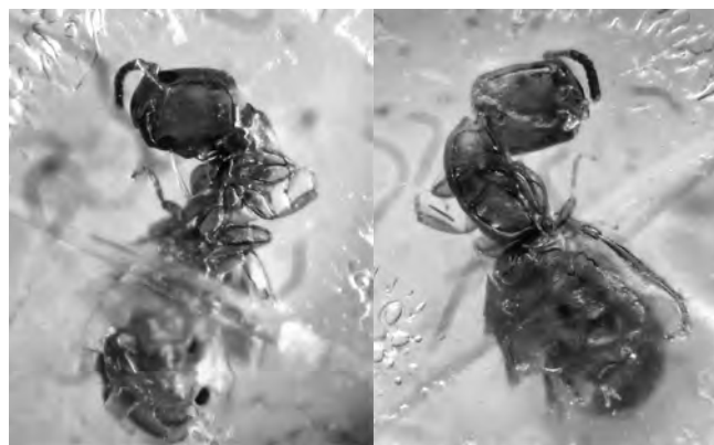
Figura 2. Aspecte dorsal (esquerra) i ventral (dreta) del cap, amb ulls compostos ben desenvolupats. Es van poder comptar 10 flagelòmers en l'antena, a més del pedicel i escap. Els 6 flagelòmers distals són foscos.

que pogués ésser la petita formiga de foc va sorgir ben aviat i em foren comunicats els tres insectes a fi de verificar si ho eren. Afortunadament, no fou el cas.